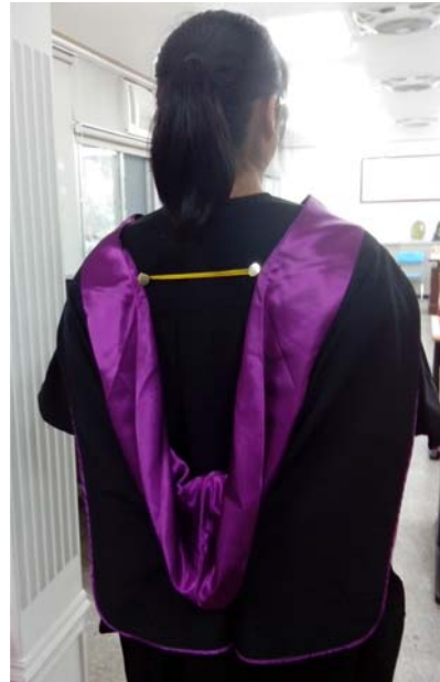
披肩穿戴方式(背面樣式)